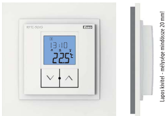
Lapos kivitel - mélysége mindössze 20 mm!