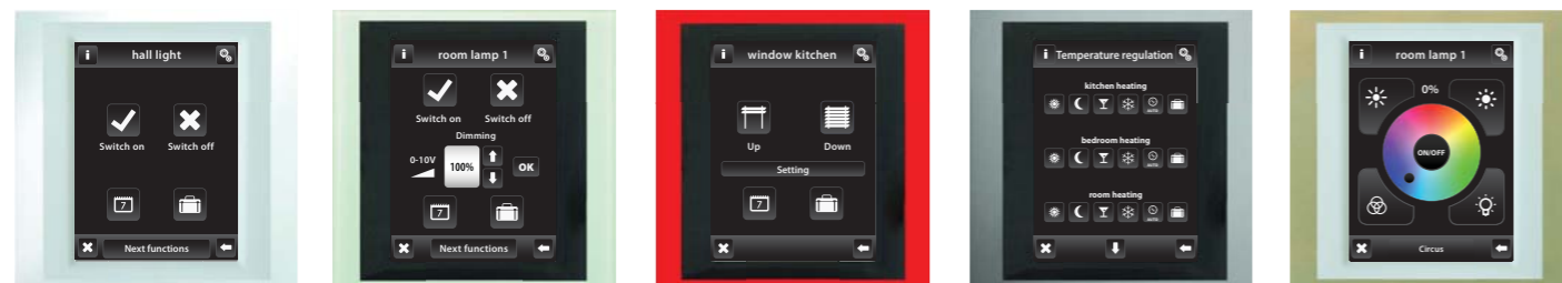
fehér / gyöngyház