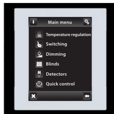
fekete / fehér