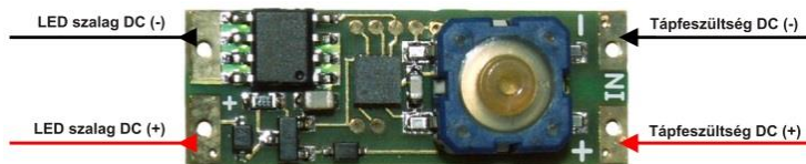
1. ábra - a dimmer modul bekötése

*) A tápfeszültség nem lehet nagyobb, mint a LED szalag maximális feszültsége!